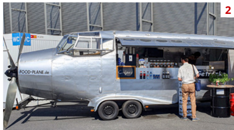
1 3 2 4